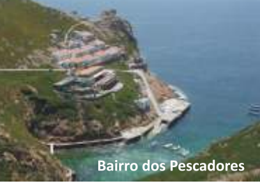
Bairro dos Pescadores