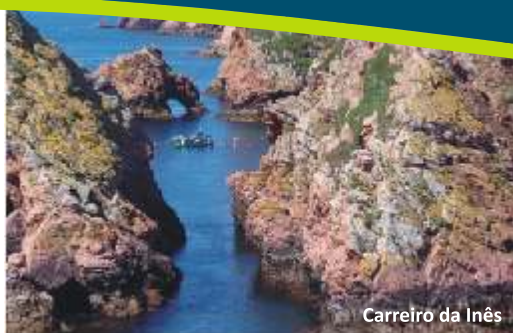
Carreiro da Inês