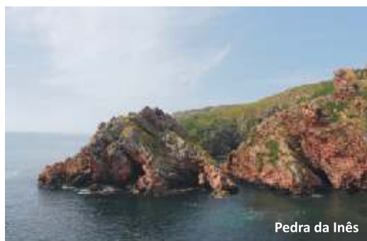
Pedra da Inês