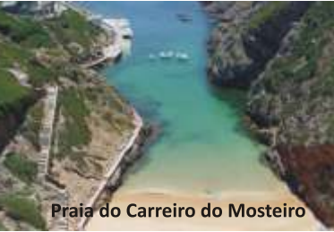
Praia do Carreiro do Mosteiro