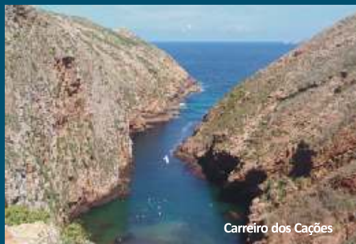
Carreiro dos Cações