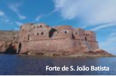
Forte de S. João Batista