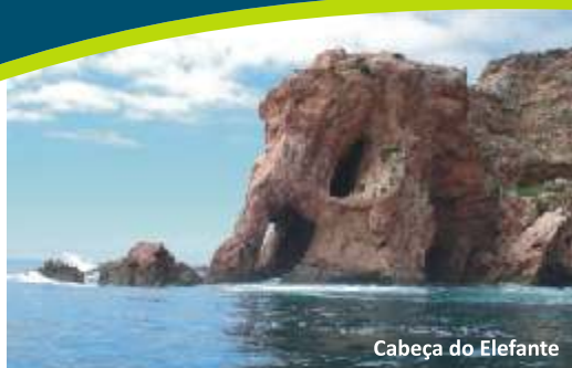
Cabeça do Elefante

As características únicas, nomeadamente a geografia e o clima, conduziram à especiação de três endemismos florísticos. Assim, entre um elenco florístico de 135 taxa presentes no arquipélago, destacam-se, pelo enorme valor conservacionista Armeria berlangensis , Herniaria lusitanica subsp. berlangiana e Pulicaria microcephala , sendo que os dois primeiros constam do Anexo II da Directiva Habitats.